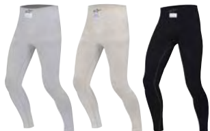
92 LIGHT GRAY 20 WHITE 10 BLACK