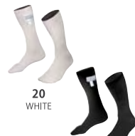
20 WHITE 10 BLACK