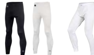
12 BLACK WHITE 21 WHITE BLACK 20 WHITE