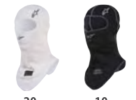
20 WHITE 10 BLACK