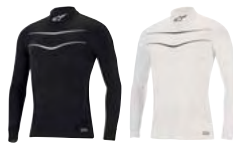
12 BLACK WHITE 21 WHITE BLACK