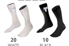
20 WHITE 10 BLACK